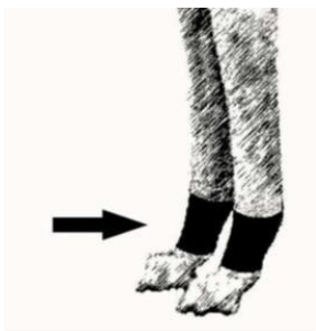
Рисунок 2. Правильно забинтованные конечности.

3.6.3.1. Разрешено применение специальных бинтов для лап для защиты когтей первых и прибылых пальцев от травм. Передние лапы должны быть забинтованы в соответствии с Рисунком 2.