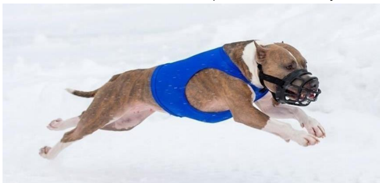
Рисунок 3. Вид попоны.

Беговые попоны должны быть изготовлены из эластичной ткани, подходить собаке по размеру и соответствовать модели, изображенной на Рисунке 3.