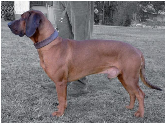
Кобель оленьего окраса