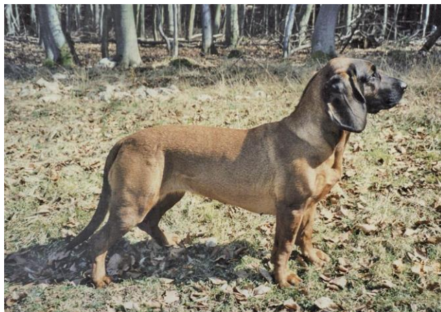
Сука оленьего окраса