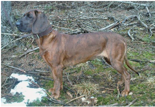
Сука тигрового окраса

ПЕРЕВОД: С. Seidler, откорректирован Е. Ререр, последние изменения & редактura выполнены Christina Bailey. Официальный оригинальный язык немецкий (DE).