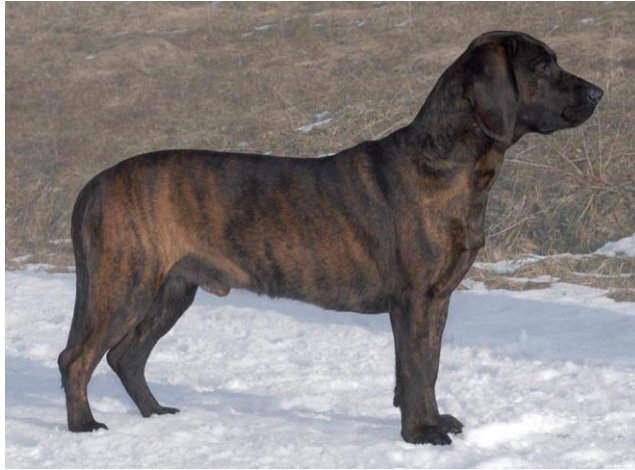
Кобель тигрового окраса