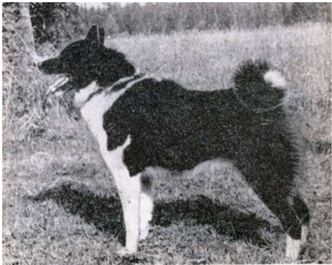
Р и с. 2. Русско-европейская лайка Карат. Оценка экстерьера «отлично». Владелец питомник ВНИИОЗ