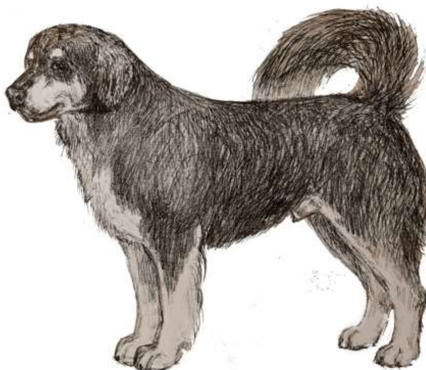
Рисунок М.Г. Островской

Данная иллюстрация не обязательно демонстрирует идеального представителя породы.