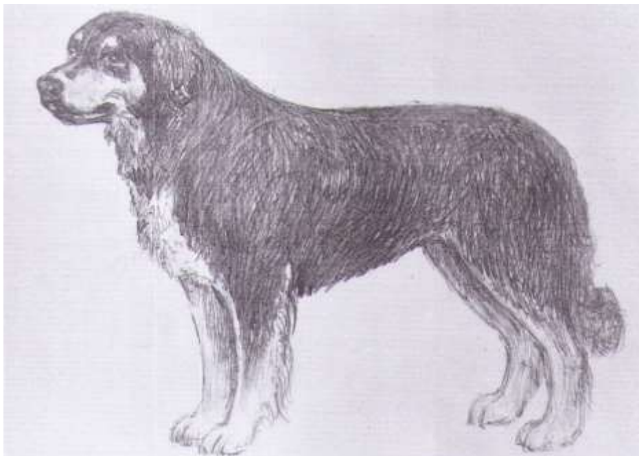
Рисунок М.Г. Островской

РОССИЙСКАЯ КИНОЛОГИЧЕСКАЯ ФЕДЕРАЦИЯ (РКФ) Комиссия РКФ по стандартам E-mail: standard@rkf.org.ru