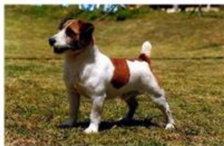
ПРОМЕЖУТОЧНАЯ РАЗНОВИДНОСТЬ (БРОУКЕН - ШЕРСТЬ СМЕШАННОГО ТИПА С ИЗЛОМОМ)